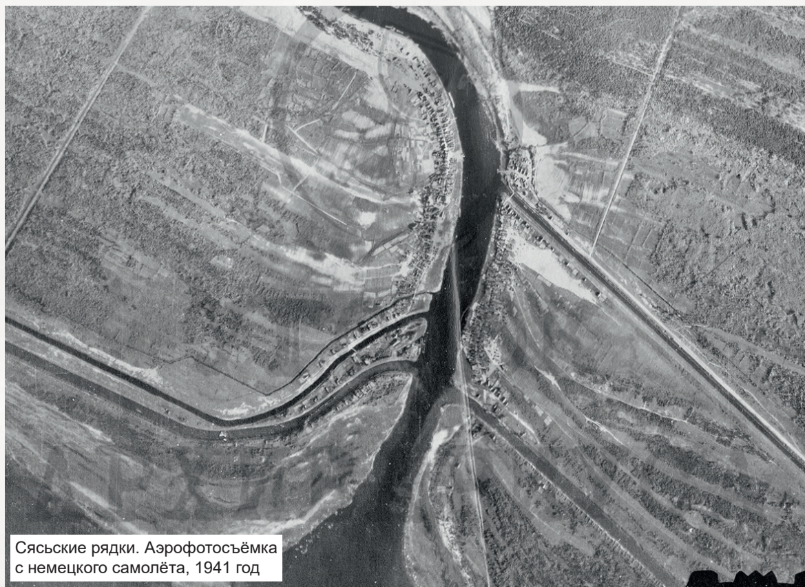
Сясьские ряды. Аэрофотосъёмка с немецкого самолёта, 1941 год