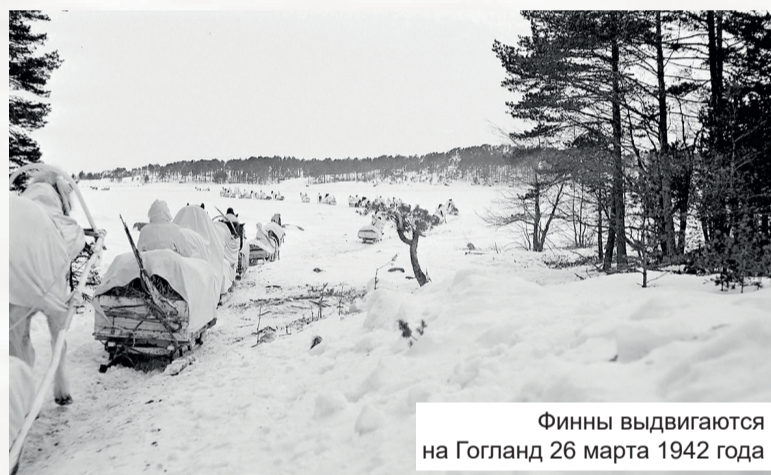
Финны выдвигаются на Гогланд 26 марта 1942 года

Заняв Гогланд, отряд полковника Барина оказался в сложном положении: финны в течение одной ночи могли получить подкрепление и атаковать остров. Отряд Барина (161 человек)