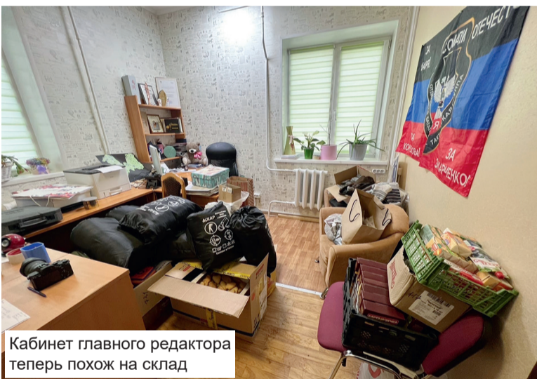
Кабинет главного редактора теперь похож на склад

– В октябре я стала руководителем районного штаба акции «Мы вместе», но я не одна. Помогает большое количество людей. Вещь