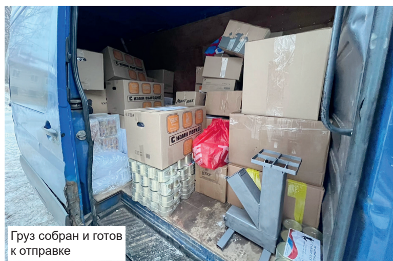
Груз собран и готов к отправке

В начале мая я зарегистрировалась как волонтер на сайте Всероссийской акции «Мы Вместе» и на несколько недель мне удалось выехать в Ростовскую область, где на границе с Донбассом располагались распределительные лагеря. Там беженцев осматривали медики, оказывали первую помощь. Там же формировались гуманитарные конвои. Несколько раз вместе с колоннами гумпомощи я оказывалась на территории ДНР. Там вместе с другими волонтерами мы ходили по домам к пожилым людям. Нам не пришлось раздавать гуманитарную помощь с машин, как часто показывают по телевизору. Мы шли по конкретным адресам к старикам, нуждавшимся в по-