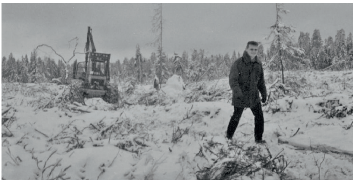
Такие участки получили наши садоводы