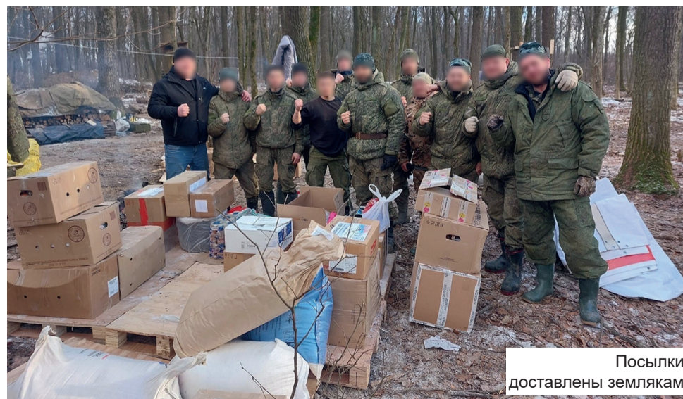
Посылки доставлены землякам

Константин КАШИН Фото из архива редакции